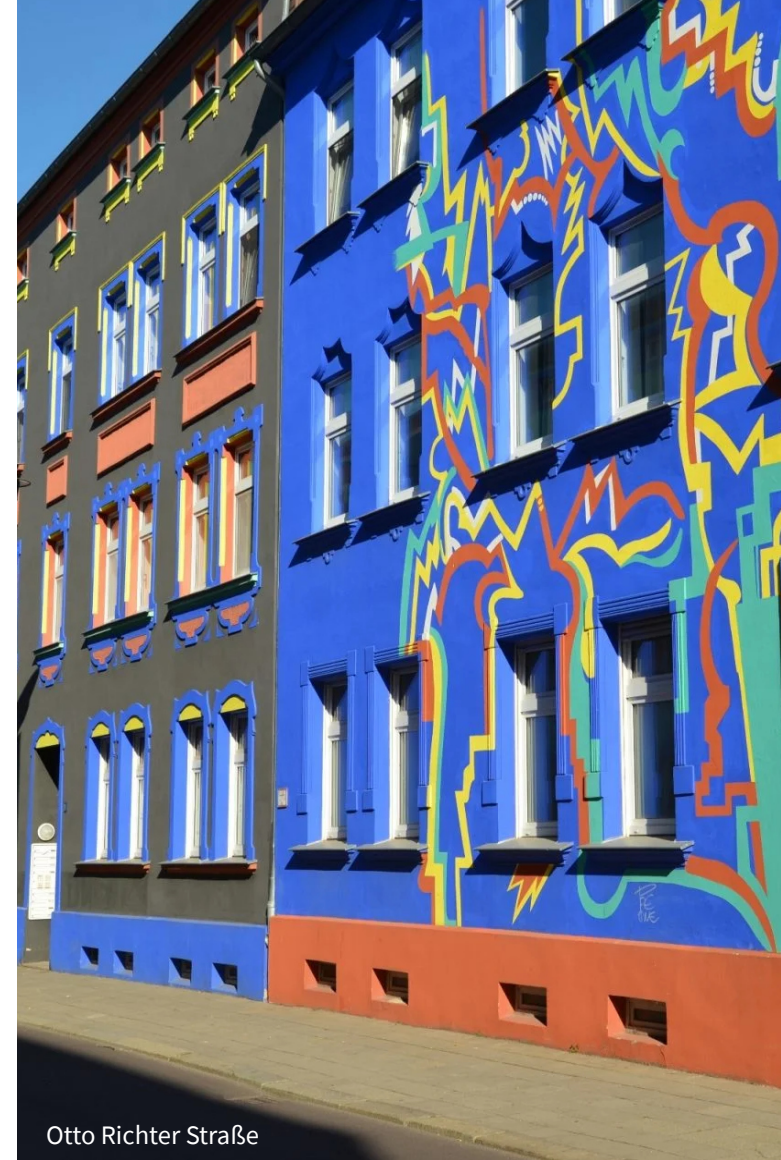
Otto Richter Straße

Der Magdeburger Dom ist mit seinem Baubeginn 1209 das älteste gotische Sakralbauwerk in Deutschland. Gleichwohl finden sich in ihm zahlreiche Relikte aus seinem Vorgängerbau, etwa die Säulen über dem Altar, die aus der römischen Antike stammen oder der ursprünglich in der ägyptischen Antike in Assuan hergestellte Taufstein. Auf der Führung erwarten Sie noch eine Reihe weiterer Sehenswürdigkeiten innerhalb des Doms.